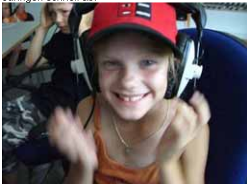
Geschafft, die erste Radiosendung verlief erfolgreich.