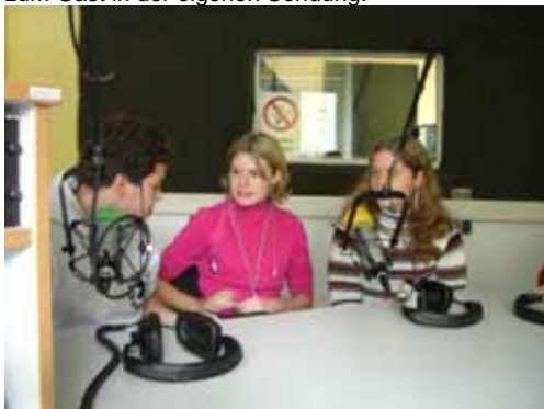
Angeregt wird während der Sendung über Spielzüge und Ergebnisse diskutiert.