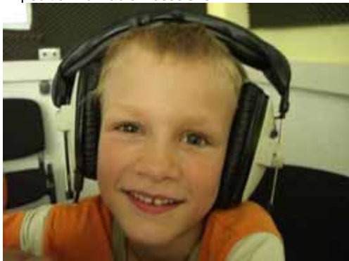
Noch sind die Kopfhörer zu groß, aber schnell wuchsen die Schüler in das Metier hinein.