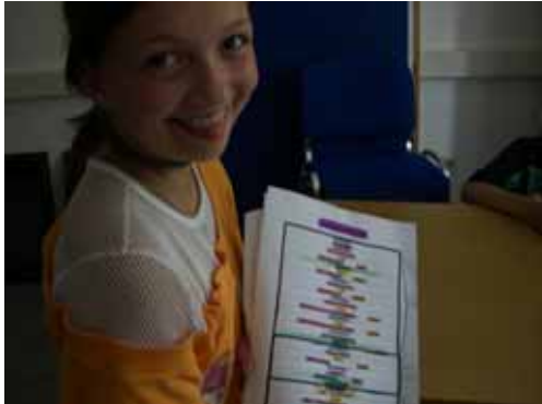
Aufwendig strukturierte Sendungen funktionieren mit einem detaillierten Sendeplan.