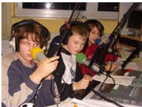
Die Sendung läuft – alleine aus Kinderhand.