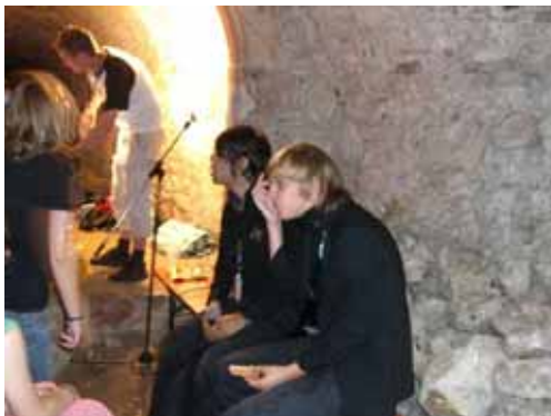
Regen bedingt zog das Studio in einen alten Tunnel um. „Timid Tiger“ störte das wenig und gab dennoch ein ausführliches Interview.