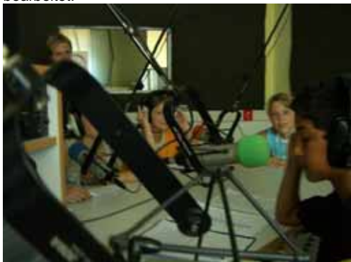
Trotz Kabelwarr und komplexer Technik behielten die Schüler den Überblick bei ihrer ersten Sendung.