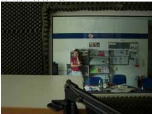
Beim „Telefonquiz“ wurde gemogelt. Der überraschte Anrufer wartete im Off-Raum auf seinen Auftritt.