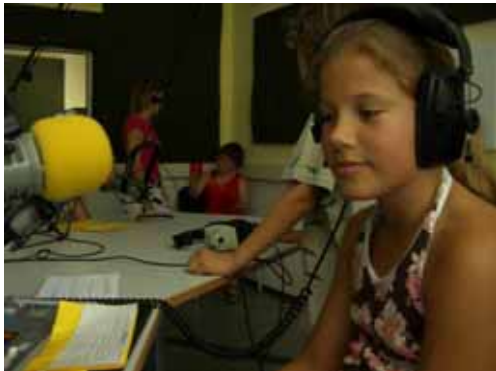
Gut vorbereitet mit Moderationskarten wartet man auf das Ende der Musik