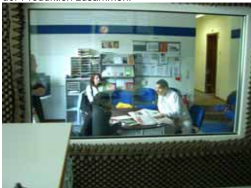
Während der Sendung feilten die Jungredakteure am letzten Schliff.