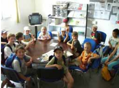
Die Ferienspielgruppe aus Flörsheim auf ihrer Expedition zu Radio Rüsselsheim