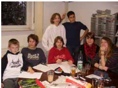
Die „neue“ Nachsitzen – Redaktion übernimmt das Kommando.