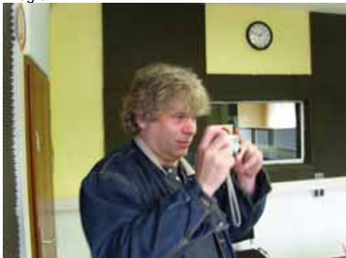
Aber auch an die eigene Zeitung wurde gedacht.