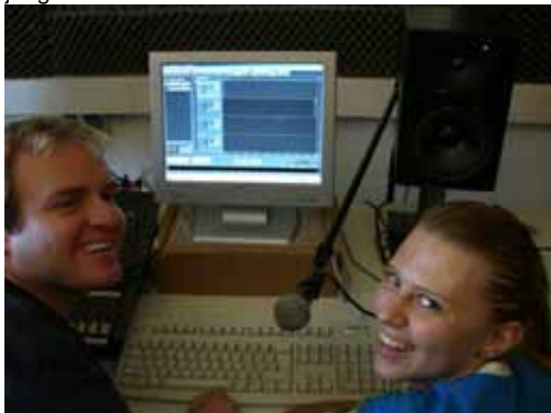
Vorproduzierte Beiträge werden im Schnitt digital bearbeitet.