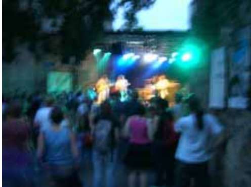
Zahlreicher Andrang vor der Bühne (hier: The Trashmonkeys)