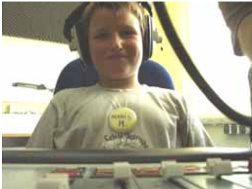
Auch die Scheu vor der Technik legten die 7 Jährigen schnell ab.