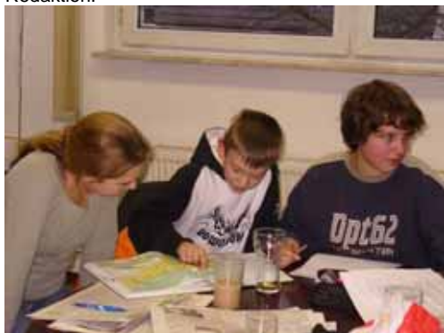
Vor jeder Sendung steht die Recherche.