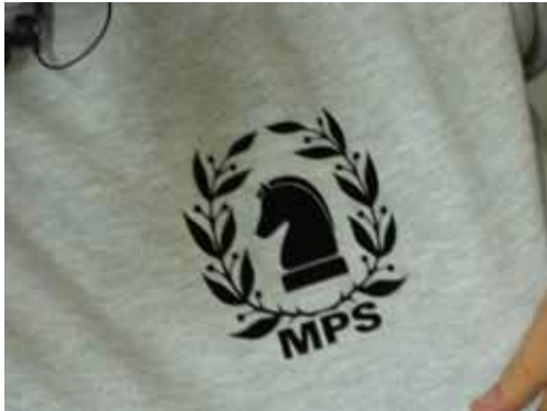
Die Schach AG der MPS ist erfolgreich. Mittlerweile treten die Mitspieler mit eigenen Trikots und Logo an.