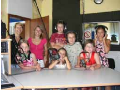
Die Ferienspielgruppe aus Kelsterbach vor dem ersten Auftritt