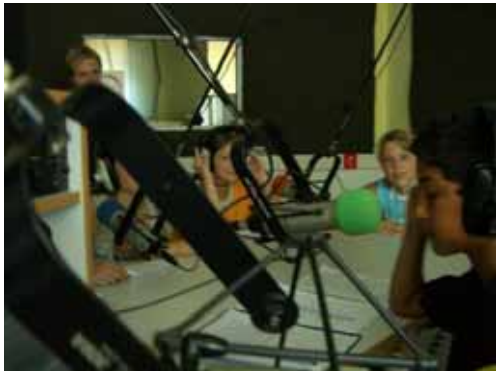
Trotz Kabelwirrwarr und komplexer Technik behielten die Schüler den Überblick bei ihrer ersten Sendung.