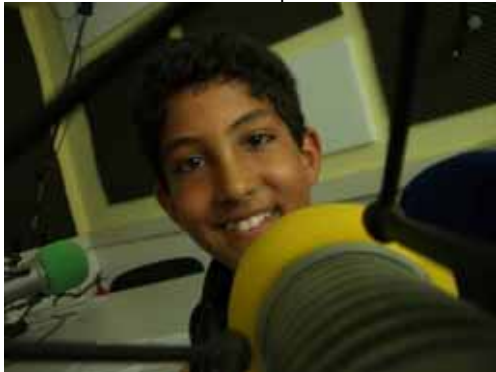
Viel Freude vor dem Mikrophon zeigten die jungen Schüler der Radio AG