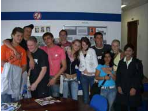
Die Berufsschüler der Franz Böhm Schule Frankfurt.